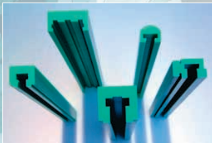
Standard, og kundespecifikke profiler