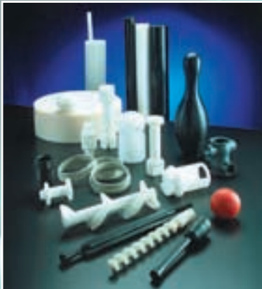
Enkeltdele, reservedele, småserier

Udover det rigtige valg af materialer, har den efterfølgende bearbejdning en lige så vigtig rolle for det endelige emne. Vores maskinpark omfatter: