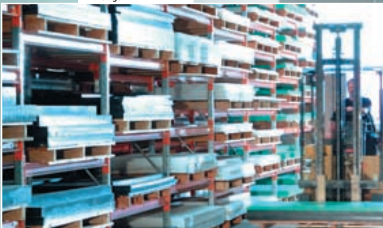
Mere end 1000 m 2 råvarelager