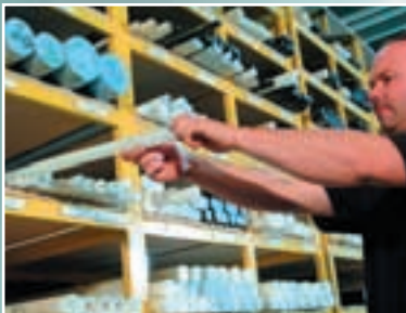
Kompetence i materialeegenskaber