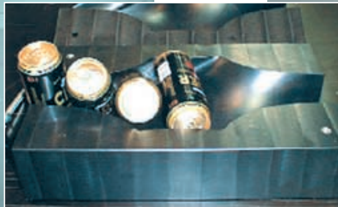
Hjertet af en dåsevender

Opmåling af dele kan enten ske hos kunder eller ved fremsendelse til vores værksted, hvorefter disse kan fremstilles med stor præcision.