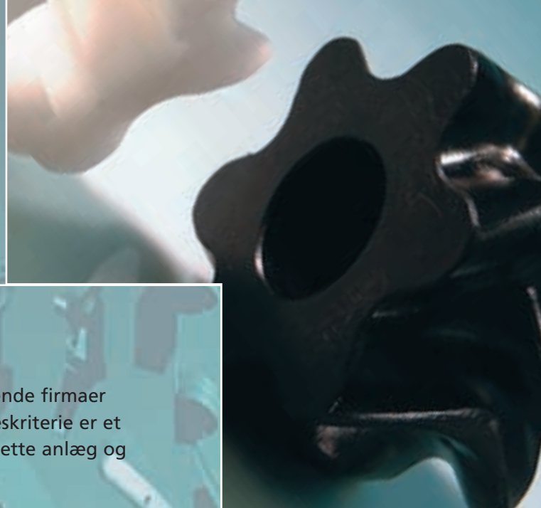
Præcisionsfremstilling af pumpehjul