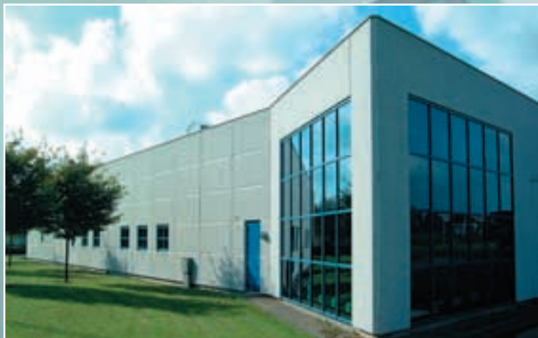
Domicil i Kolding: Lager, produktion og konstruktion under eet tag.

Vores know how indenfor specielle maskindele, er kendt ud over Danmarks grænser. Sammen med vores kunder udvikler og gennemfører vi specifikke løsninger, som ligger langt udover den normale standard, lige fra materialevalg, over konstruktion og produktion til endelig montage ved kunden.