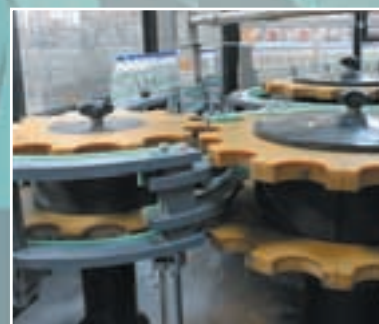
Transportstjerner for aftapningsanlæg